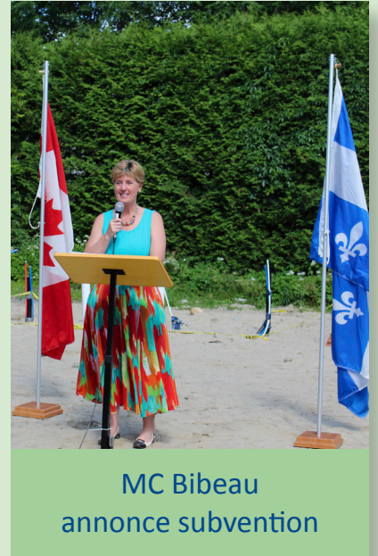
MC Bibeau annonce subvention